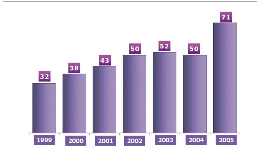
Figura 1. Evolución de la participación (años 1999-2005): número de centros participantes.